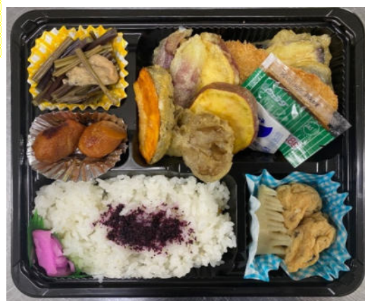
5月16日に調理したお弁当